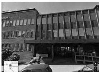
Ingången till Lofströms allé.